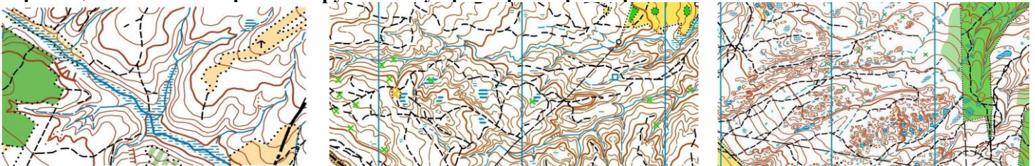
Попередні параметри (+-10%) дистанцій

Карти підготовлені у 2020 р. Автор: Юхим Штемплер та залучені молоді судді-картографи Чернівецької області. Тираж на струменевому принтері. Карты герметизовані.